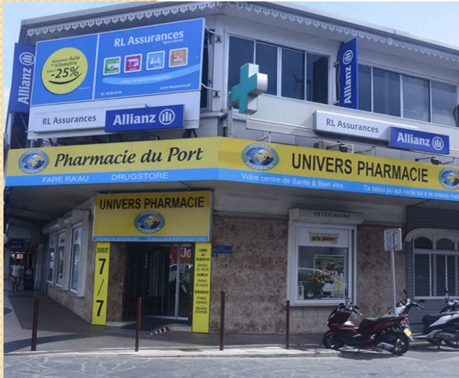
Un cabinet médical (près d'une pharmacie)