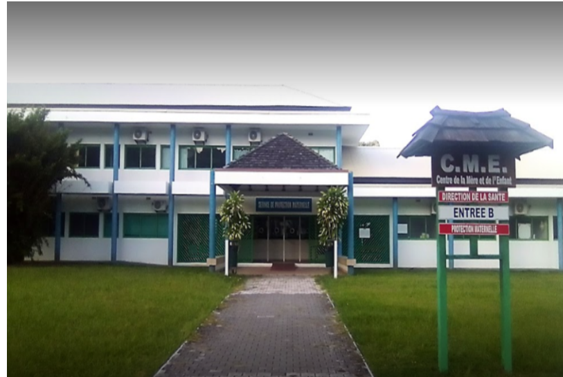
Le Centre de la Mère et de l'Enfant