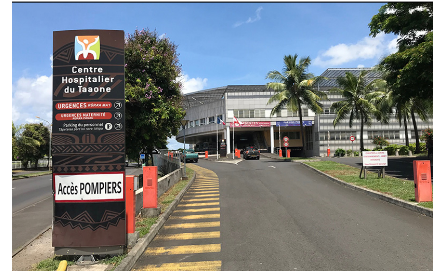
Le Centre Hospitalier du Taaone